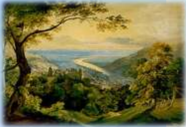
Heidelberg - Carl Rottmann, 1815

Il centro storico e il castello: ad Heidelberg la storia si respira ad ogni passo. La città con l' università più antica della Germania (fondata nel 1386) ha una storia di più di 800 anni. In quest'arco di tempo la città ha attratto poeti come Goethe, Eichendorff e Mark Twain. Artisti famosi come Turner, Fohr e Trübner si sono ispirati alle sue impressioni vivaci e diversi compositori come Brahms, Schumann o