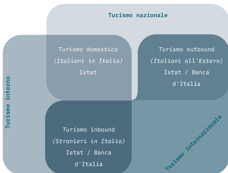
Fig. 10.1 Le diverse prospettive di analisi del turismo

Come evidente dalla figura 10.1, i punti di osservazione per le indagini sul turismo presentano alcune sovrapposizioni: il turismo interno all'Italia è effettuato sia da residenti ('domestico') che da stranieri ('inbound'); il turismo nazionale, sia domestico, sia di viaggiatori italiani all'estero ('outbound'); il turismo internazionale, sia 'inbound' sia 'outbound'.