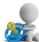
Asili nido/Centri estivi