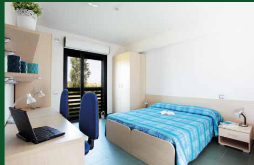
CX Deluxe Plus

Camera doppia di 16mq (con possibilità di uso singola) con bagno privato in appartamento con soggiorno e angolo cottura condivisi. Affaccio esterno. DOTAZIONE STANDARD: Divano, forno a microonde, piano cottura, grill, frigorifero, doccia, termoarredo, phon.