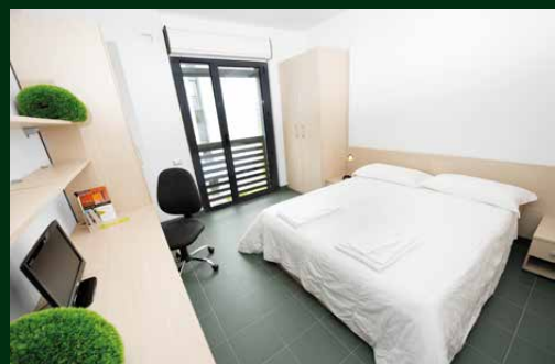
CX Studio Executive

Camera doppia (con possibilità di uso singola) con bagno in appartamento con soggiorno e angolo cottura. Affaccio esterno. DOTAZIONE STANDARD: Divano, forno a microonde, piano cottura, grill, frigorifero, doccia, termoarredo, phon.