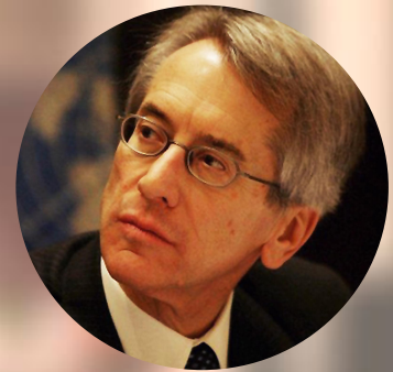
Ambasciatore ed ex Ministro degli Affari Esteri