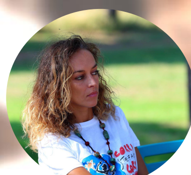
Giulia Bosetti Stefano Cucchi Onlus