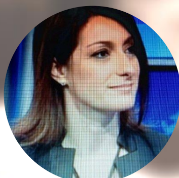
Diva Ricevuto Sulle Regole