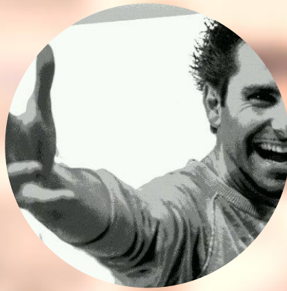
Emotional Trainer at UNREAL UNREAL - emotional training