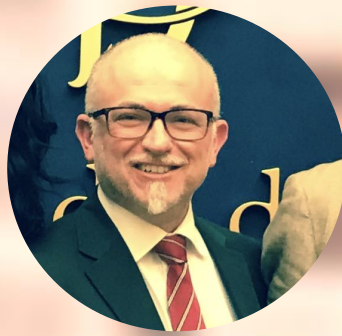
Davide Mattiello Parlamentare membro della Commissione di Giustizia e della Commissione Parlamentare d'inchiesta sul fenomeno delle Mafie