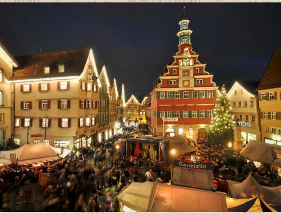
mercatini di natale medievali Esslingen