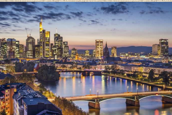
Frankfurt am Main