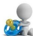
Asili nido/Centri estivi