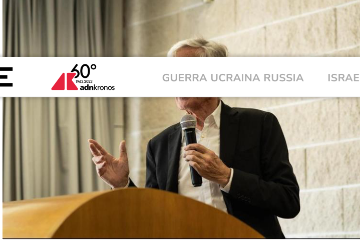
Derrick de Kerckhove

La comunicazione deve sopravvivere alla presa di controllo delle persone tramite gli algoritmi. Deve andare oltre il rapporto tra il cliente 'burattino' e l'inserzionista 'burattinaio'